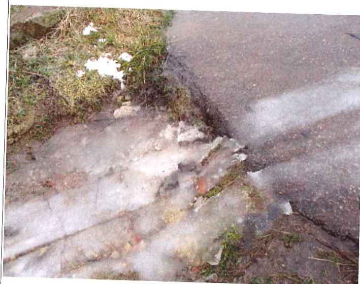
Asfalta dangos kraštų nutrupėjimas.